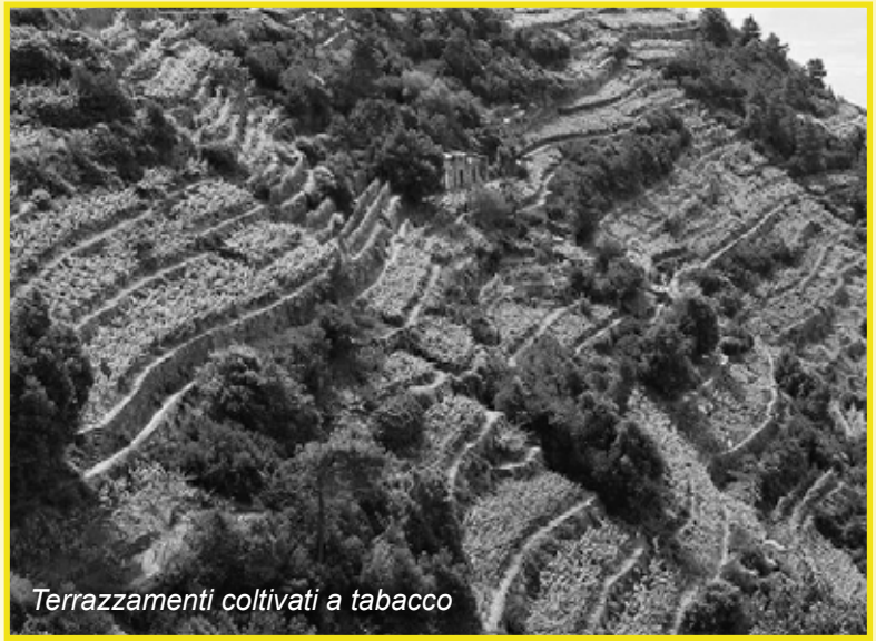
Terrazzamenti coltivati a tabacco

parazione del terreno. Con un accurato lavoro di zappa compito riservato, normalmente, alle donne si procedeva all'asportazione della " rega ", raccogliendola in allineate fasce. Quindi, sparso il " leamo " (lettame), trasportato con la " siliera " (tavole di abete fissate a due bastoni) o nei " bugaroi " (grossi