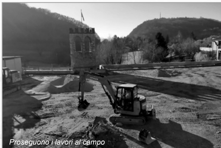
Proseguono i lavori al campo

Vi posso rinfrescare alcuni particolari: i semafori per regolare il traffico in prossimità delle curve inizialmente programmati contemporaneamente nei due sensi, quindi tutti e due o sul rosso o sul verde...grande esercizio di telepatia e di prontezza di riflessi; persone specia-