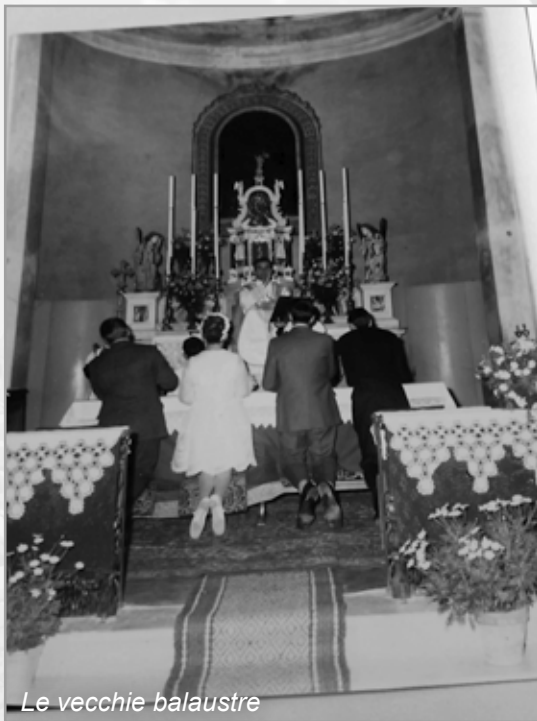
Le vecchie balaustre