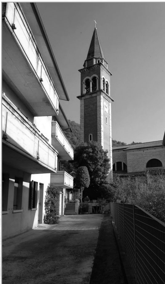
foto del campanile scattata dalla mia abitazione

Il suono delle campane inoltre serviva, e ancora serve, per chiamare i fedeli alla Santa Messa, indicando loro quanto manca all'inizio della celebrazione. Una volta si suonava un'ora prima dell'inizio della funzione religiosa e venivano suonate due campane dal suono chiamato "Doppio"; mezz'ora dopo, invece, veniva suonata una sola campana e questo suono era chiamato "Ave Maria". Dopo un quarto d'ora la stessa campana suonava di nuovo e questo suono era chiamato "Cenno". Qualche minuto prima dell'inizio della celebrazione religiosa suonava ancora la stessa campana e quando smetteva, si suonava una campana più piccola, detta anche campanino, chiamato "Ultimo", durante il quale i fedeli dovevano già trovarsi in chiesa. Le campane venivano suonate da una persona chiamata campanaro che con