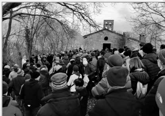
Tradizionale celebrazione di inizio anno a S. Bovo, per la prima volta senza Eusebio.