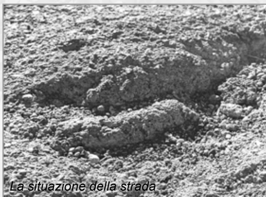
La situazione della strada