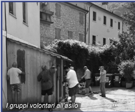
I gruppi volontari all'asilo